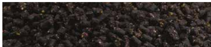
MX5729 BLACK MAGIC

Ízesítés: Citrom-narancs Szín: Sárga Jellemzők: Szénhidrát alapú micropellet