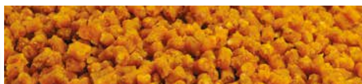
MX5712 GOLD FEVER

A Feeder Guru etető pelletek kis méretű, 3 mm-es granulátumok. Nedvesség hatására külső felületük felpuhul, kis idő elteltével egy nyomásra szépen összeállnak gombóccá, így alkalmasak önmagukban történő etetésre, vagy kosárba tömésre, töltőformával method kosárban is használhatjuk. A fél kilós kiszerezésű dobozban megtalálható egy kisméretű liquid is, amely további lehetőséget ad a pelletek ízesítésére.