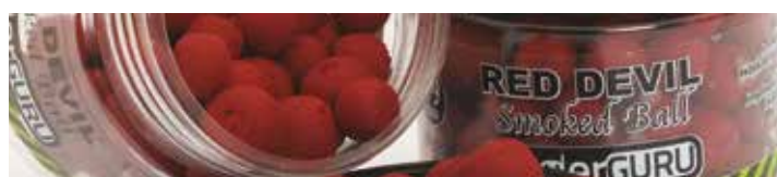
MX3691 RED DEVIL

Ízesítés: Eper-málna Szín: Piros Jellemzők: Vérző, lebegő