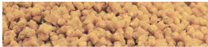
MX1487 SWEET CORN

Ízesítés: Eper-málna Szín: Piros Jellemzők: Szénhidrát alapú micropellet