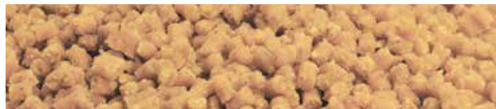
MX2540 WHITE GHOST

Ízesítés: Csoki-karamell Szín: Barna Jellemzők: Szénhidrát alapú micropellet