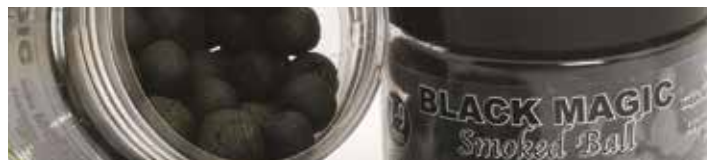
MX3714 BLACK MAGIC

Ízesítés: Ánizs-kolbász Szín: Fekete Jellemzők: Vérző, lebegő