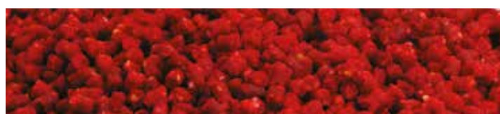
MX5705 RED DEVIL

Ízesítés: Csoki-narancs Szín: Narancssárga Jellemzők: Szénhidrát alapú micropellet