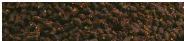
MX1291 SWEET BROWN

Ízesítés: Ánizs-kolbász Szín: Fekete Jellemzők: Szénhidrát alapú micropellet