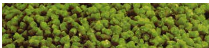
MX5699 GREEN BETAIN

Ízesítés: Fokhagyma-mandula Szín: Fehér Jellemzők: Szénhidrát alapú micropellet