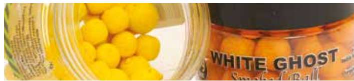
MX1494 SWEET CORN

Ízesítés: Édeskukorica Szín: Sárga Jellemzők: Vérző, lebegő