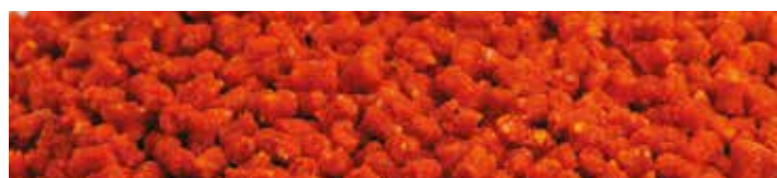
MX2793 ORANGE LUCKY

Ízesítés: Hal-kagyló Szín: Zöld Jellemzők: Szénhidrát alapú micropellet