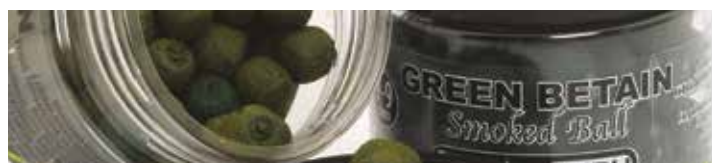
MX3684 GREEN BETAIN

Ízesítés: Hal-kagyló Szín: Zöld Jellemzők: Vérző, lebegő