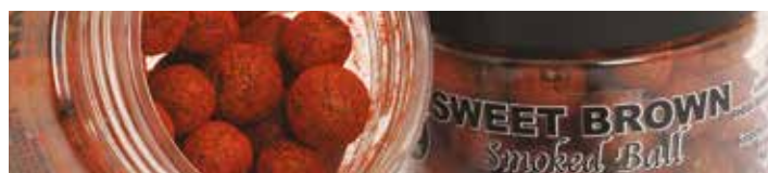
MX3738 SWEET BROWN

Ízesítés: Csoki-karamell Szín: Barna Jellemzők: Vérző, lebegő