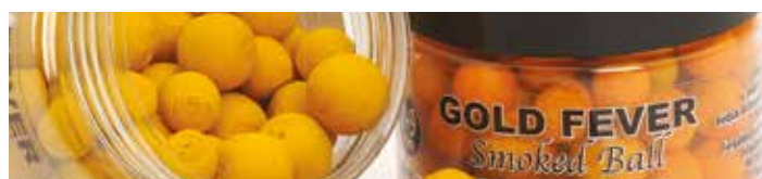
MX3707 GOLD FEVER

A Smoked Ball egy olyan különleges lebegő csali, mely más márkák termékeitől eltérően a szín mellett illatanyagot is enged ki magából. A víz alatt a Smoked Ball hosszú ideig tartó aroma és színelhőt képez maga körül, így a legóvatosabb halakat is kapásra bírhatjuk vele. Lebegő tulajdonságú, ám a megfelelő méretű horoggal a fenéken tarthatjuk a csalit, melyet így a halak könnyen beszippantanak. 7 és 9 mm-es változatban kerül forgalomba.