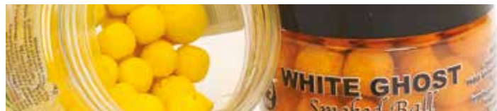
MX3721 WHITE GHOST

Ízesítés: Fokhagyma-mandula Szín: Fehér Jellemzők: Vérző, lebegő