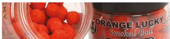
MX3745 ORANGE LUCKY

Ízesítés: Csoki-narancs Szín: Narancssárga Jellemzők: Vérző, lebegő